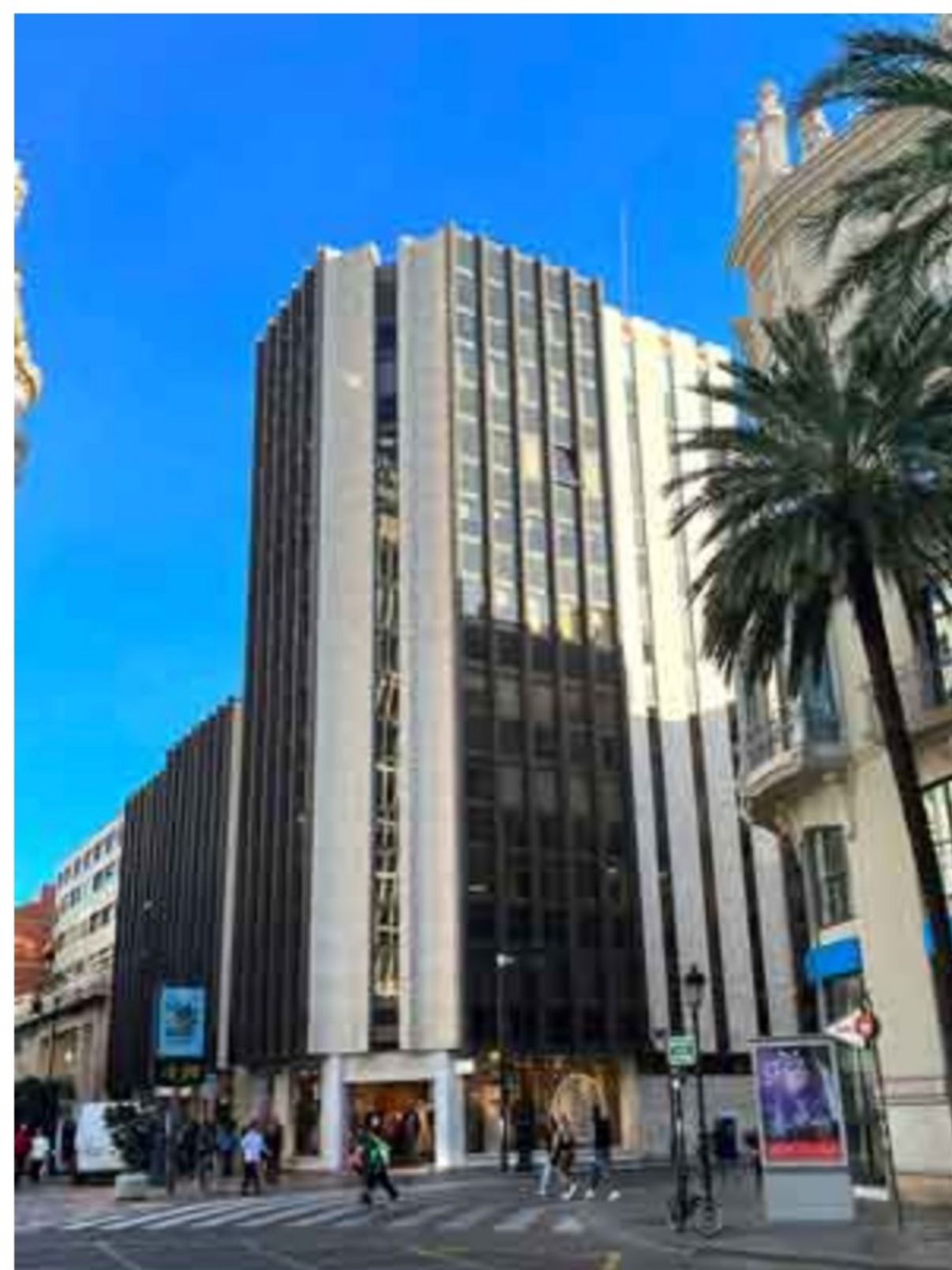
La sede della succursale spagnola di Assicuratrice Milanese